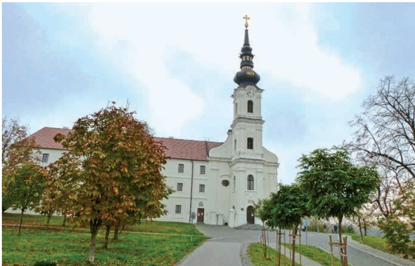
Samostan i crkva sv. Filipa i Jakova u Vukovaru

Za sve što nije bilo očitovanje Božje ljubavi u našem životu na početku ovoga slavlja iskreno se pokajmo. Oprostimo jedni drugima i ispovjedimo pouzdanje u Božje milosrđe koje nas dovodi do oltara i već nas ovdje na zemlji okuplja na nebesku gozbu.